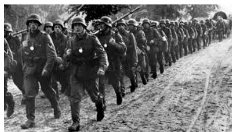
Wehrmacht marschiert in Polen ein