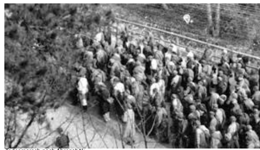
Todesmarsch nach Ahrensböck

Der Marsch führte von Fürstengrube nach Ahrensböck, und wer nicht mehr laufen konnte, wurde einfach erschossen. Am Ende überlebten nur etwa 200 von den 1.000 Häftlingen.