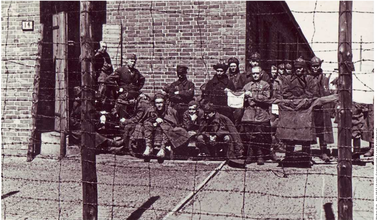
Walter Sch., Mai 1942

Sowjetische Kriegsgefangene im »Stalag X B« in Sandbostel 1942: Perverse Rassenhierarchie der Nazis